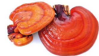
Reishi Ganoderma lucidum