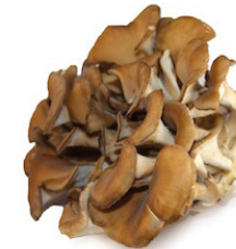
Maitake Grifola frondosa