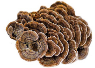
Trametes Trametes versicolor